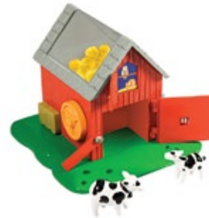
Bright Basics™ Busy Barn