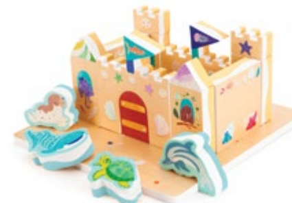
Bright Basics™ Bath Blocks