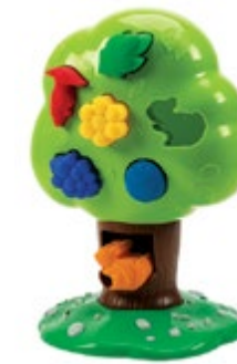
Bright Basics™ Sorting Tree