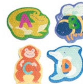
Bright Basics™ ABC Tubbies