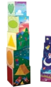
Bright Basics™ Nest & Stack Cubes