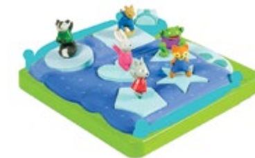
Bright Basics™ Shape-Sorting Popper