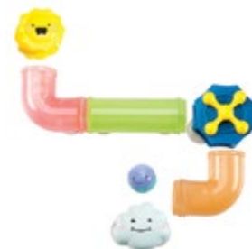
Bright Basics™ Slide & Splash Spouts