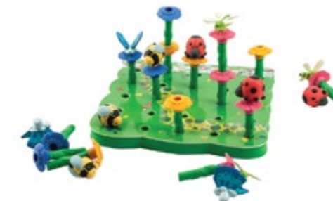
Bright Basics™ Peg Garden

Developed in Southern California by Educational Insights. © Educational Insights, Gardena, CA (U.S.A.). All rights reserved. Learning Resources Ltd., Bergen Way, King's Lynn, Norfolk, PE30 2JG, UK. Please retain the package for future reference. Made in China. educationalinsights.com