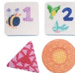
Bright Basics™ 123 Tubbies