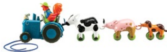
Bright Basics™ Tractor Pull