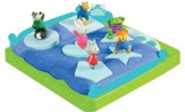
Bright Basics™ Shape-Sorting Popper