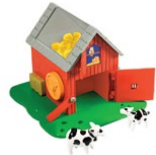
Bright Basics™ Busy Barn