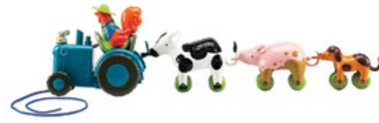
Bright Basics™ Tractor Pull