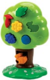
Bright Basics™ Sorting Tree