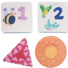
Bright Basics™ 123 Tubbies