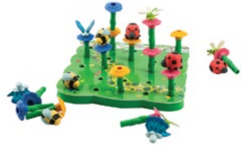
Bright Basics™ Peg Garden

Developed in Southern California by Educational Insights. © Educational Insights, Gardena, CA (U.S.A.). All rights reserved. Learning Resources Ltd., Bergen Way, King's Lynn, Norfolk, PE30 2JG, UK. Please retain the package for future reference. Made in China. educationalinsights.com