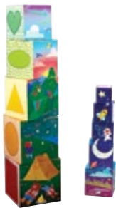
Bright Basics™ Nest & Stack Cubes