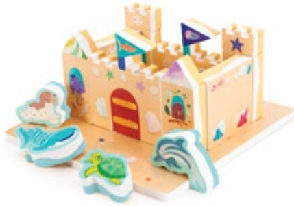
Bright Basics™ Bath Blocks