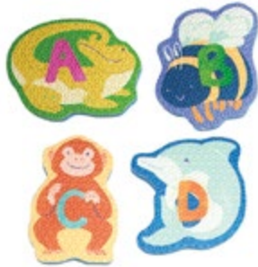
Bright Basics™ ABC Tubbies