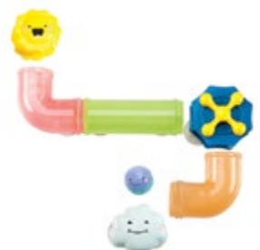
Bright Basics™ Slide & Splash Spouts